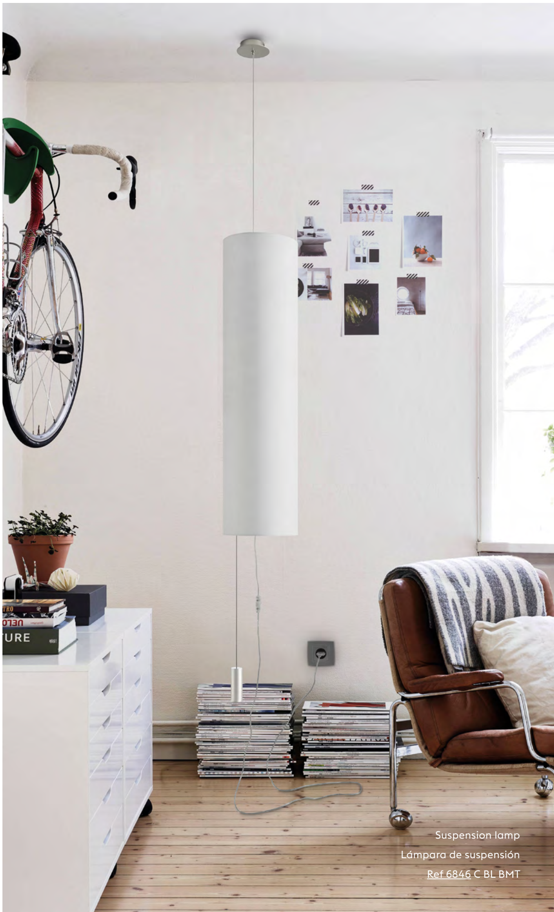
Suspension lamp Lámpara de suspensión Ref 6846 C BL BMT