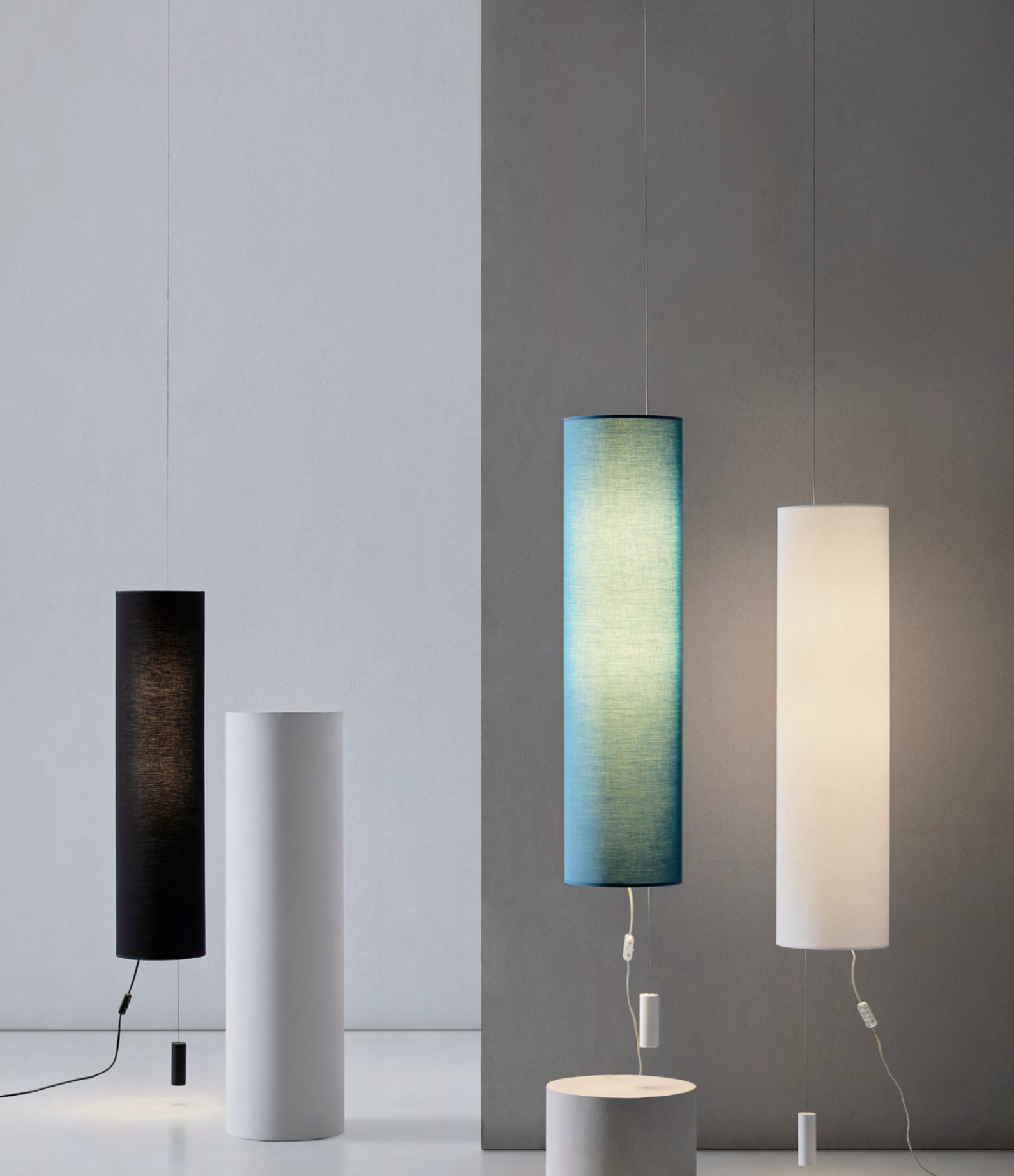
Suspension lamps Lámparas de suspensión Ref 6846 C NE NMT