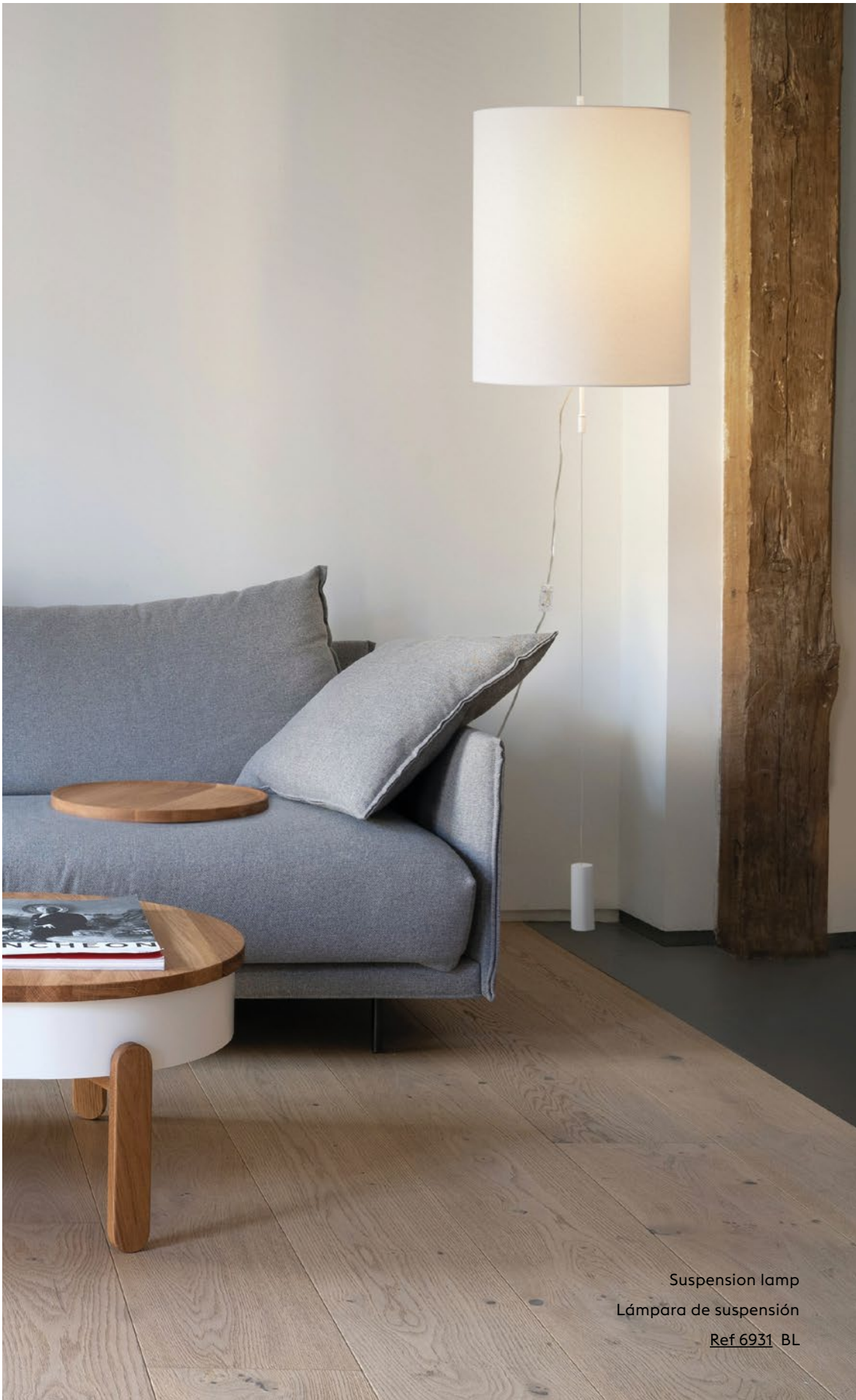
Suspension lamp Lámpara de suspensión Ref 6931 BL